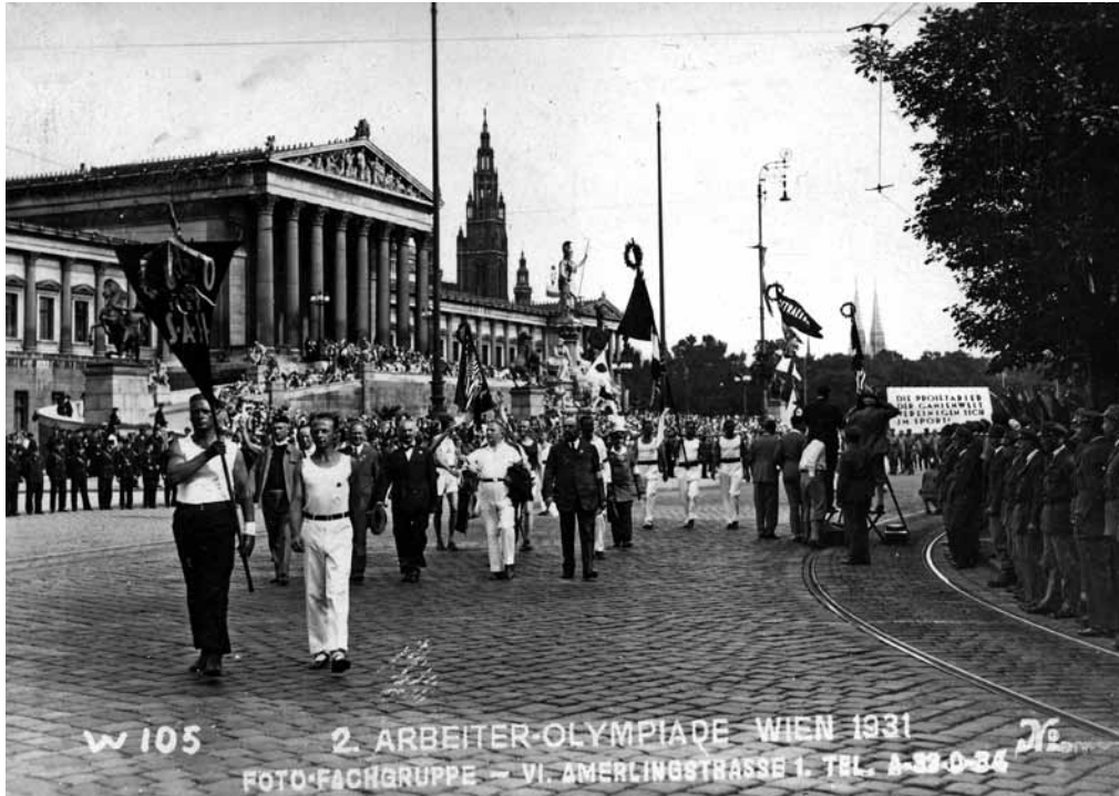
Fra åpningsseremonien til arbeiderolympiaden i Wien 1931. I første rekke går Julius Deutsch, daværende leder av Den sosialistiske sportsinternasjonale (SASI), og langs hele togruten står uniformerte medlemmer av hans egen paramilitære organisasjon, Republikanischer Schutzbund.

land. Massenes innordning og disiplin var kjernen i den proletariske, sosialistiske estetikk.