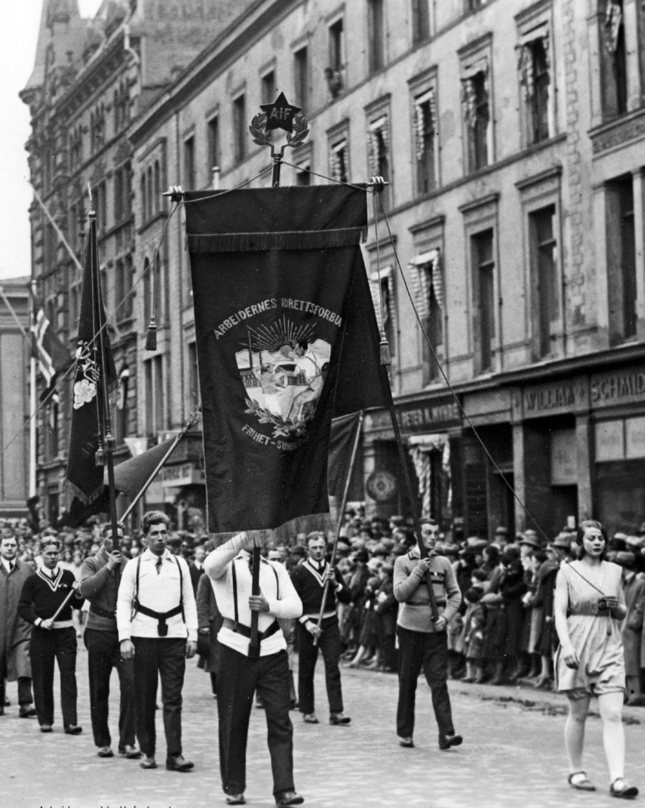
Arbeidernes Idrettsforbunds seksjon i 1. maitoget 1931.