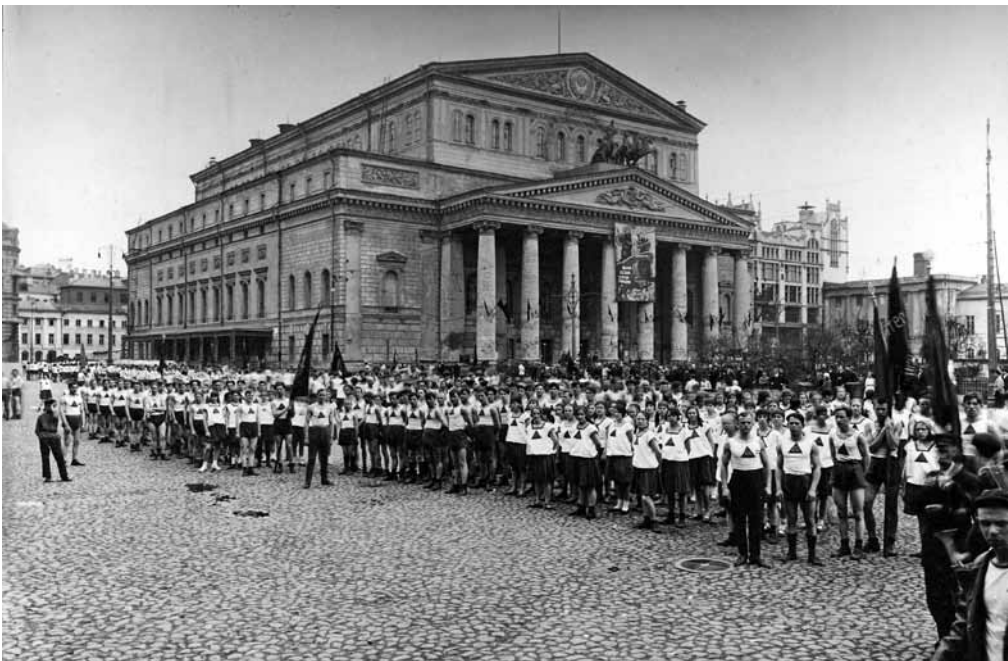
Arbeideridrettsutøvere tilsluttet det sovjetiske Nærings- og Nytelsesmiddelarbeiderforbund stiller opp til avmarsj i forbindelse med den fysiske kulturs dag i Moskva 1925.