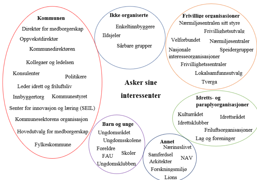
Figur 3 Asker kommune sine interessenter delt inn etter hvilken rolle de har

Her ser vi et utdrag av alle interessenter som er nevnt av informantene som kan være relevant å samarbeide med for å skape fysisk aktivitet i nærmiljøet. Her er alle som spiller en rolle.