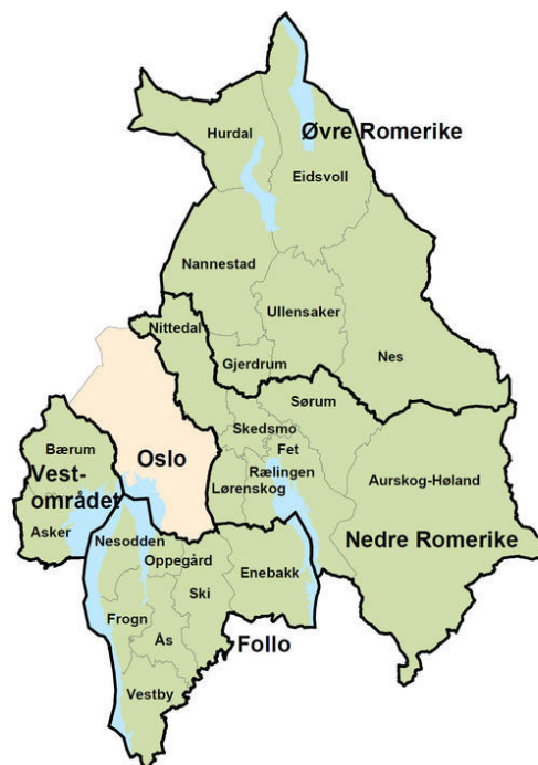
Figur 1 4

Slik beskrives Romerike på deres turistvennlige hjemmeside 3 . I det følgende kommer jeg til å si mye om kvinnefotballen på Romerike, og jeg mener derfor det er viktig å fortelle litt om dette Akershusdistriktet. Først og fremst er det geografien som er viktig, da det vil bli enklere å plassere navn på både steder og klubber som nevnes senere. Romerike deles gjerne inn i en øvre og nedre del, og det vil også være nyttig å vite hvilke steder som tilhører hvilken del. Avslutningsvis i dette kapittelet vil jeg se litt nærmere på Aurskog-Høland kommune, da det er her vi finner både Setskog og Høland.